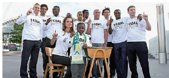
Samen voor één doel: onderwijs voor iedereen.

1Goal, een nieuwe campagne van Global Campaign for Education, werkt samen met de FIFA, internationale leiders, voetballers en filmsterren om zoveel mogelijk voetballers deel te laten nemen aan het initiatief. Ook premier Balkenende bevestigde op 7 oktober zijn steun in gezelschap van oud-voetballer Ruud Gullit en andere prominenten in het Catshuis, met als doel: Onderwijs voor iedereen. 'Ik roep iedereen ter