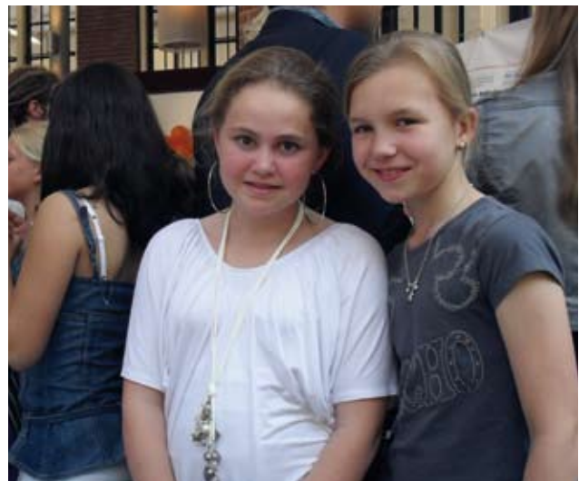
Basisschoolkinderen in actie voor DayforChange.

We gaan in gesprek met de kinderen over wat een microkrediet kan bijdragen aan een beter leven. We discussiëren over 'niet geven maar lenen'. Veel indruk maakt een plaatje over een dik gezin met vóór zich eten voor een week; de overdaad straalt er vanaf. Kosten: 234 euro. Dan is er het contrast: een gezin in Ethiopië voor hun tent met eten voor een week. Het zijn wat granen en groenten. Kosten: 14 euro. Een schokkend beeld dat direct aangeeft hoe de verhoudingen tussen arm en rijk in deze wereld zijn.'