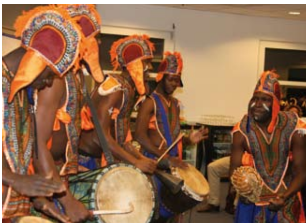
Met optredens van Azangounon was het een sfeervol evenement African Spirit in Amersfoort.

Botti en Toure vertelden over het opzetten van een markthal in oorlogstijd, dankzij de hulp en een lening van Oikocredit. Theo Hesens gaf een workshop over het werk van IKV Pax Christi in Soedan. Er waren ook twee creatieve workshops: Afrikaanse dans, verzorgd door de bandleiden van Azangounon, en Afrikaanse verhalen vertellen door Angèle Jorna.