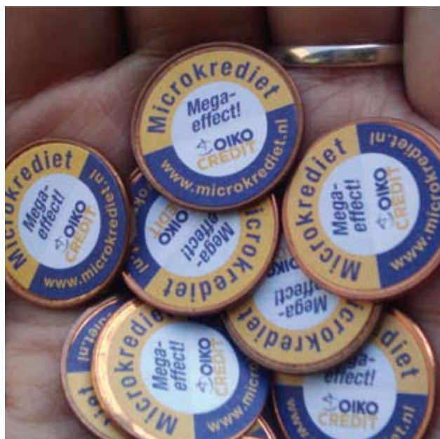
Muntgeld gebruikt tijdens de omgekeerde collecte van de campagne Geloven in het kleine.