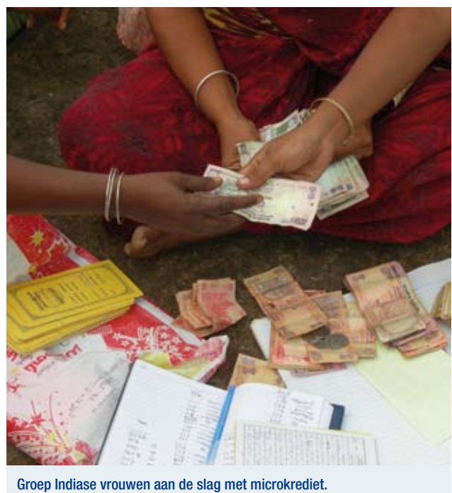
Groep Indiase vrouwen aan de slag met microkrediet.

De winst- en verliesrekening van het ONF werd met een positief resultaat van 58.000 euro afgesloten. Het interim-dividend kon op het gebruikelijke niveau van 3,10 euro (1,55%) worden gehandhaafd.