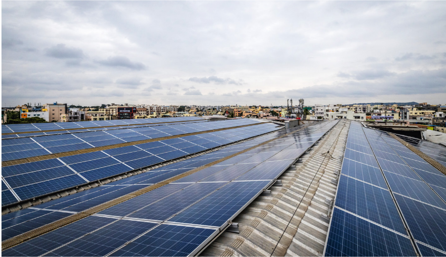
Etliche Themen, die bei der ethischen Geldanlage zu beachten sind, sind relativ eindeutig, wie die Förderung von Solarenergie. Das Foto zeigt eine Photovoltaikanlage auf dem Dach eines Supermarkts in Hyderabad, Indien, die vom Oikocredit-Partnerunternehmen Fourth Partner Energy betrieben wird.

schließlich mit der eigenen Geldanlage auch wohl fühlen. Oder andere, die Waffen schrecklich finden, aber in Aktien von Waffenproduzenten investieren, weil die so tolle Kurssteigerungen haben.