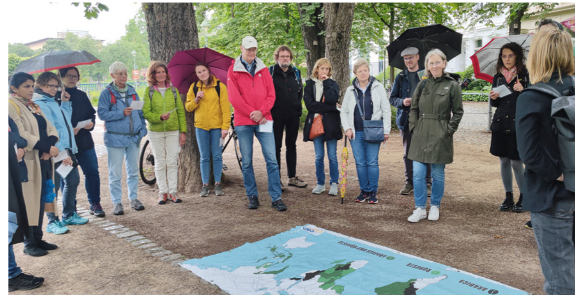
Die Weltkarte bildete eine Station des Walk & Talk in Bonn.