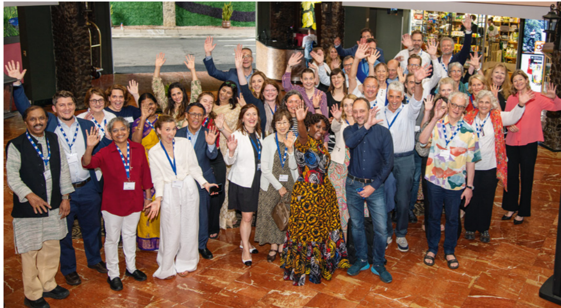
Gute Stimmung: Die Teilnehmer*innen der Generalversammlung.