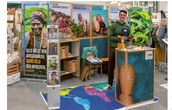
Aktiv am gemeinsamen Infostand beim Rapunzel-Festival in Legau.

Was hat Oikocredit mit Rapunzel Naturkost zu tun? Eine ganze Menge! Denn in vielen der fair gehandelten Produkte stecken Zutaten von Oikocredit-Partnerunternehmen. Ein Großteil der Kakaoverzeugnisse wie Schokoladen oder Trinkschokolade enthält beispielsweise Bio-Kakao von Conacado aus der Dominikanischen Republik. Auch die Kaffeekooperative Norandino aus Peru zählt zu den Lieferanten von Rapunzel. Die Mitglieder der Kooperative sind Kleinbäuer*innen, die von Zusatzleistungen wie Investitionen zur Qualitätsverbesserung profitieren. Am 21. und 22. September feierte Rapunzel sein 50-jähriges Jubiläum in der Rapunzel-Welt in Legau (Allgäu). Ganz im Südwesten Bayerns gelegen, feierten sowohl der Förderkreis Bayern als auch der Förderkreis Baden-Württemberg mit, die gemeinsam einen Infostand gestalteten.