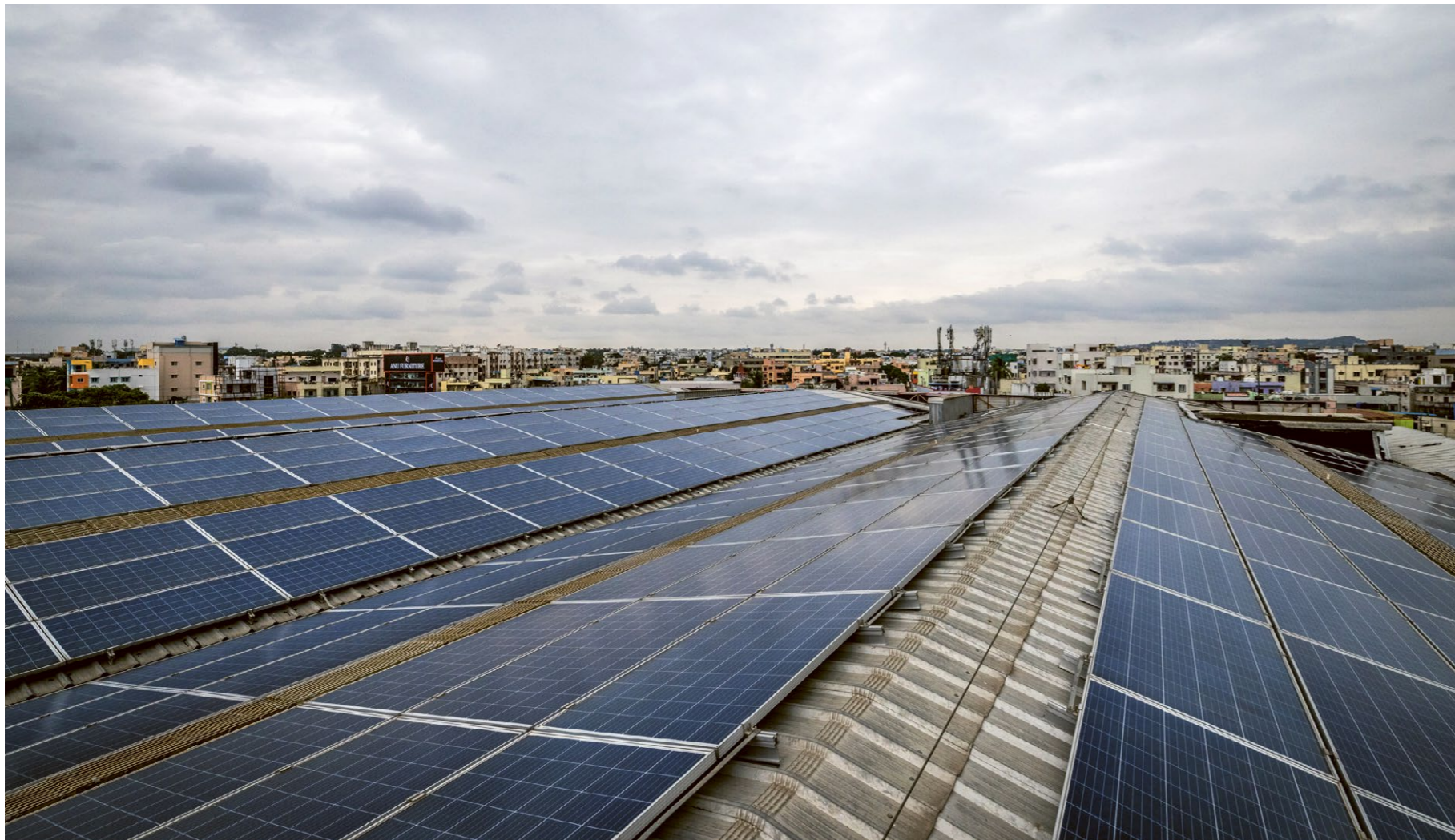
Etliche Themen, die bei der ethischen Geldanlage zu beachten sind, sind relativ eindeutig, wie die Förderung von Solarenergie. Das Foto zeigt eine Photovoltaikanlage auf dem Dach eines Supermarkts in Hyderabad, Indien, die vom Oikocredit-Partnerunternehmen Fourth Partner Energy betrieben wird.

schließlich mit der eigenen Geldanlage auch wohl fühlen. Oder andere, die Waffen schrecklich finden, aber in Aktien von Waffenproduzenten investieren, weil die so tolle Kurssteigerungen haben.