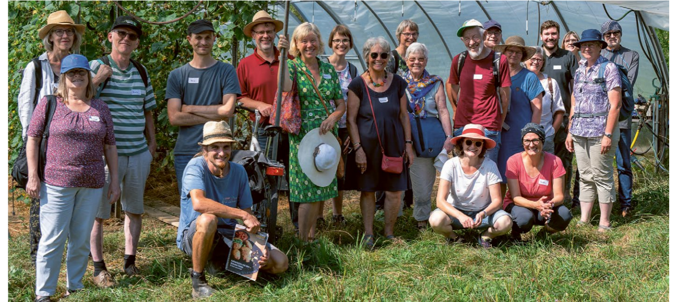
Gruppenbild vor einem Gewächshaus des Reyerhofs.

Mengen getrennt mahlen. Einige Oikocredit-Förderkreis-Mitglieder erinnerte dies an die Problematik des Mengenausgleichs im Fairen Handel. Oder auch das Thema „faire Löhne“, die in der Landwirtschaft alles andere als üblich sind. Die transparente Kostenkalkulation zeigte aber den Solawi-Mitgliedern, wie schlecht „ihre“ Beschäftigten bezahlt wurden. Die Gemeinschaft sprach sich daraufhin für höhere Löhne aus - auch wenn es für sie höhere Beiträge zur Konsequenz hatte.